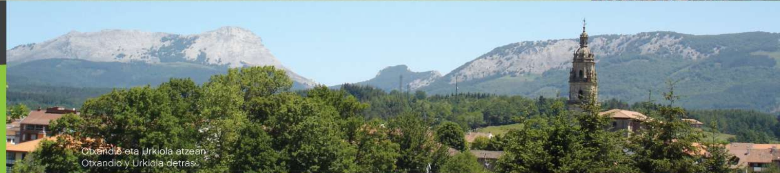
Otxandio eta Urkiola atzean Otxandio y Urkiola detrás.