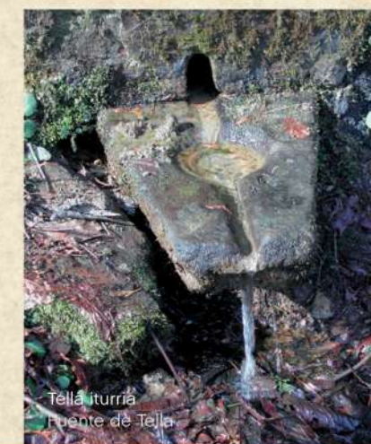
Tella iturria Fuente de Tella

Una vez allí solamente nos resta regresar al punto de partida, cogiendo para ello el camino que junto al viejo matadero se dirige hacia la Plaza Nagusia, pasando por Mainerrota.