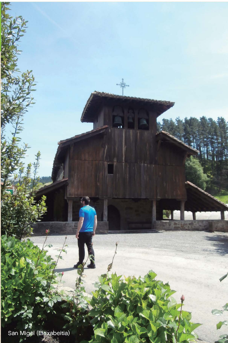
San Miguel (Elexabeitia)